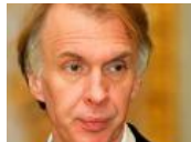
Огрызко: Сейчас Путин отползает назад, но холодная война не ..