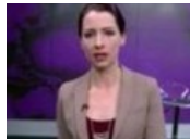
Ведущая российского канала осудила действия Кремля: "Я ..

Редакция не несет ответственности за содержание комментариев читателей. Вся ответственность за содержание комментариев возлагается на комментаторов