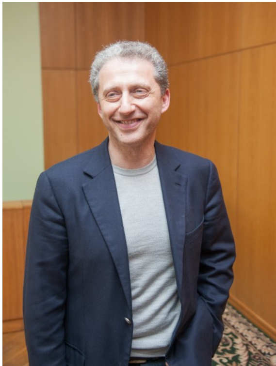
Подготовил Денис Корнышев